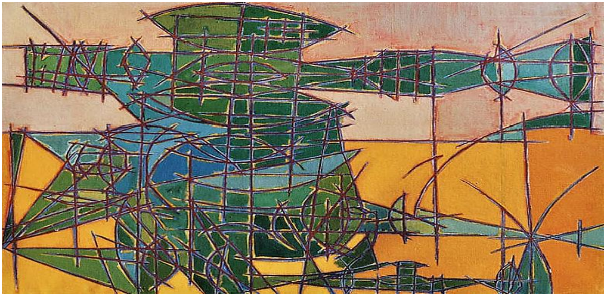
Huile sur toile représentant un rotor, 1958 - © Musée aeroscopia