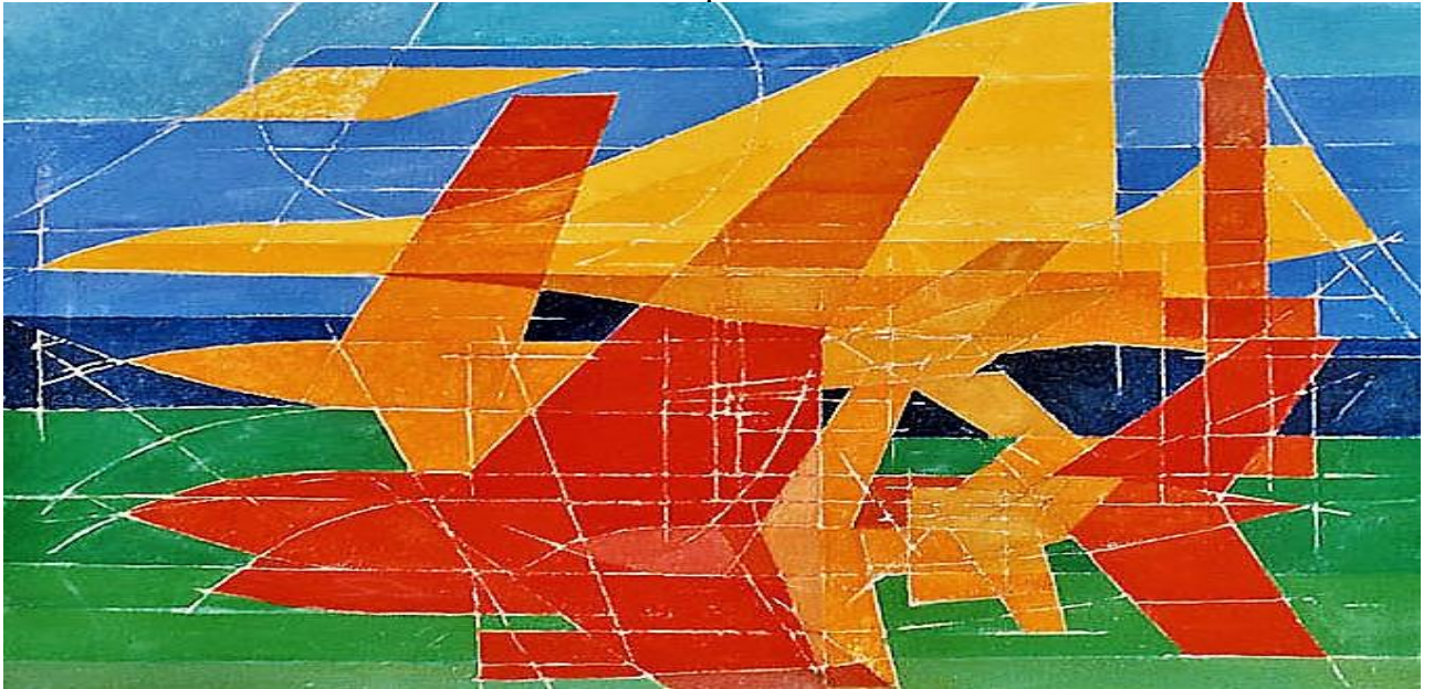
Composition pour Aérospatiale, 1975