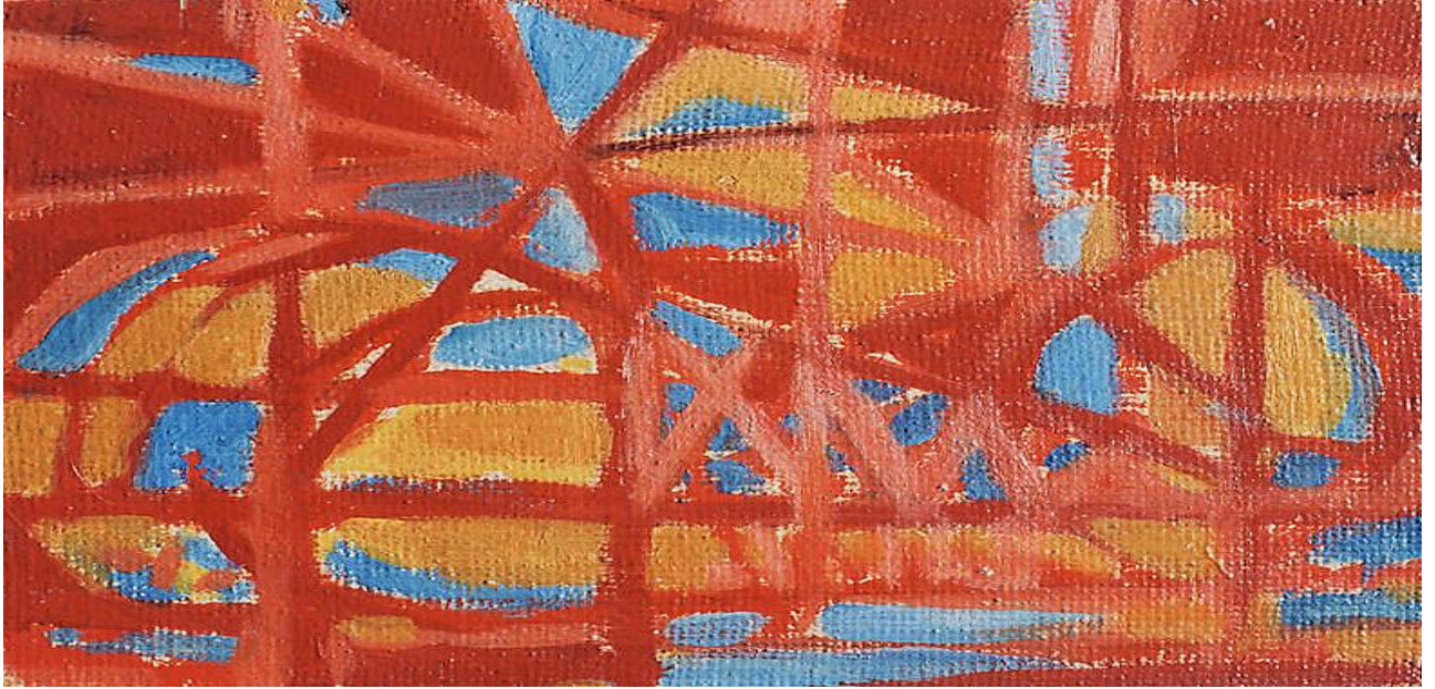
Peinture de l'Alouette sur isorel, 1959