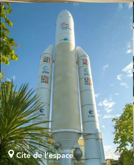
Cité de l'espace