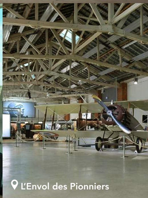
L'Envol des Pionniers